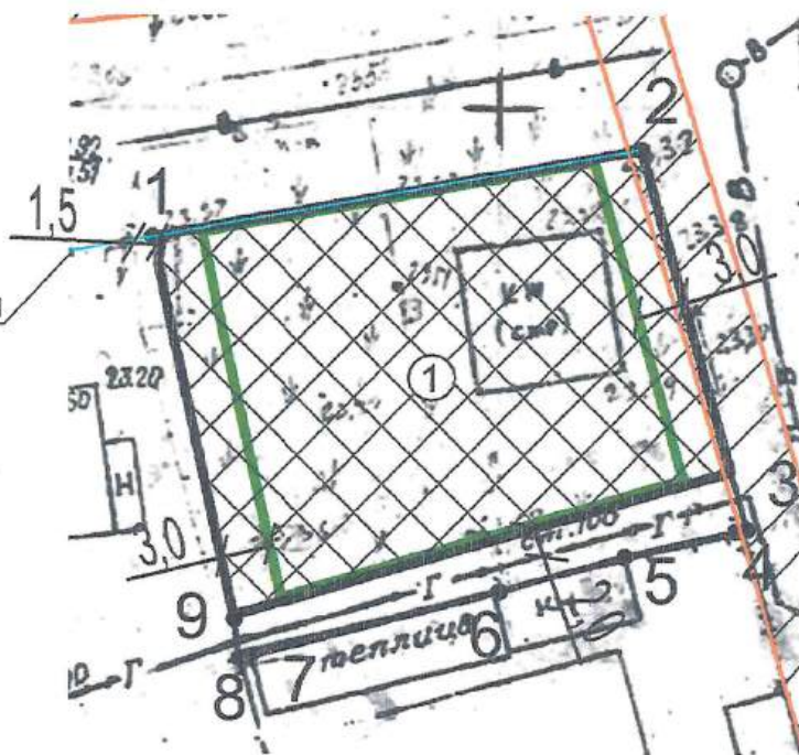
Каталог координат границ земельного участка (местная система г.Астрахань)